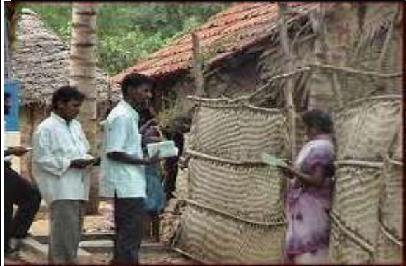
இயேசுவே மெய்யான ஒளி

“ஞானவான்கள் ஆகாயமண்டலத்தின் ஒளியைப்போலவும், அநேகரை நீதிக்குட்படுத்துகிறவர்கள் நட்சத்திரங்களைப் போலவும் என்றென்றைக்குமுள்ள சதா காலங்களிலும் பிரகாசிப்பார்கள்” (தானி 12 : 3).